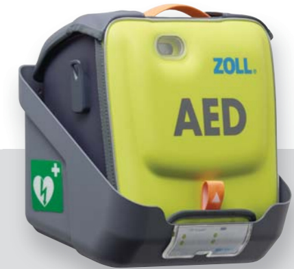
Universeel ophangstelsysteem met ZOLL AED 3 met koffertje en reserveset CPR Uni-padz (in het koffertje) Onderdeelnr. 8000-001266