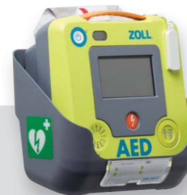
Universeel ophangstelsysteem met ZOLL AED 3 zonder koffertje Onderdeelnr. 8000-001255

In het universele ophangstelsysteem kan de ZOLL AED 3 aan de muur worden bevestigd, met of zonder het bijbehorende koffertje. Op het ophangstelsysteem is het groene AED-symbool van ILCOR aanwezig. Het systeem wordt geleverd met hulpmiddelen voor de bevestiging, een kaart waarop de verbruiksartikelen kunnen worden bijgehouden, een voorbeeld voor de bevestiging en instructies voor het ophangen.