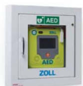
Half ingebouwde wandkast Onderdeelnr. 8000-001257

muur wordt bevestigd, is het eenvoudigst te installeren; de half ingebouwde en volledig ingebouwde modellen steken minder hinderlijk uit. Alle drie de modellen worden geleverd met een set stickers met het ILCOR (International Liaison Committee on Resuscitation) AED-logo en instructies voor de installatie.